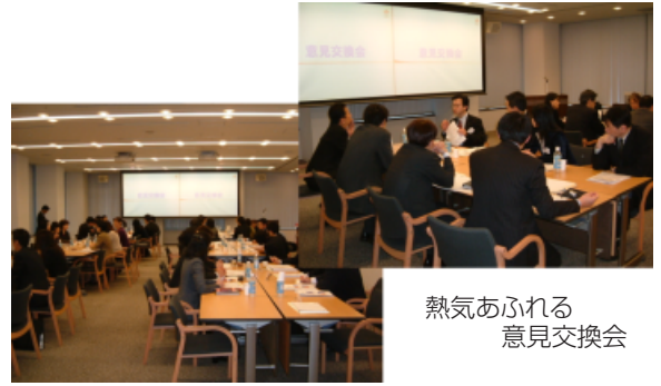
熱気あふれる 意見交換会

事例発表の後、少人数グループに分かれての意見交換会が行われました。初めて顔をあわせるご担当同士、やや緊張した滑り出しとなりましたが、すぐに各グループとも盛んな情報交換や質疑応答が交わされ、その意欲に満ちたディスカッションに、担当する当社社員にとっても大変参考となる交換会となりました。