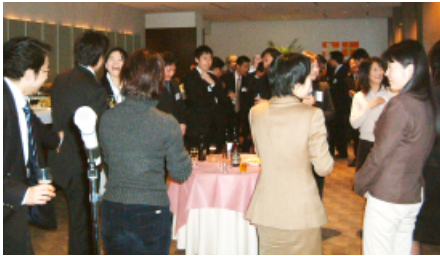
和気あいあいとした懇親会