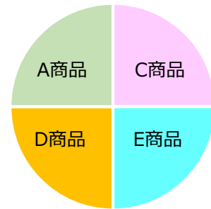
今後の掛金の配分割合

「掛金の配分割合」とは、掛金で購入する運用商品や購入割合を指定・変更することです。