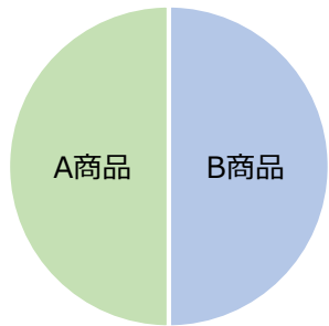
現在の掛金の配分割合